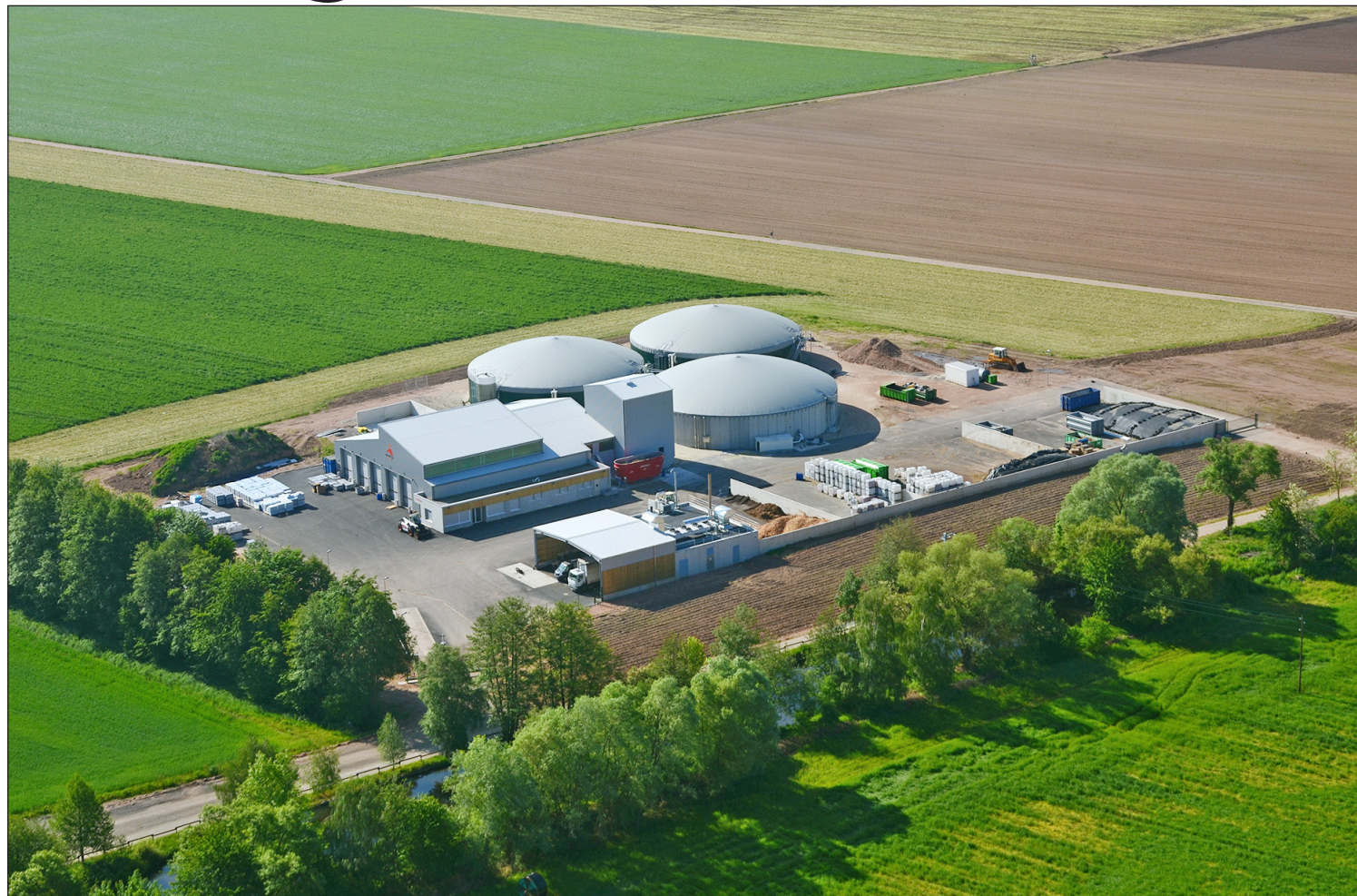
Méthanisation, photovoltaïque, matériaux biosourcés, l'agriculture a de l'énergie à produire et à revendre !